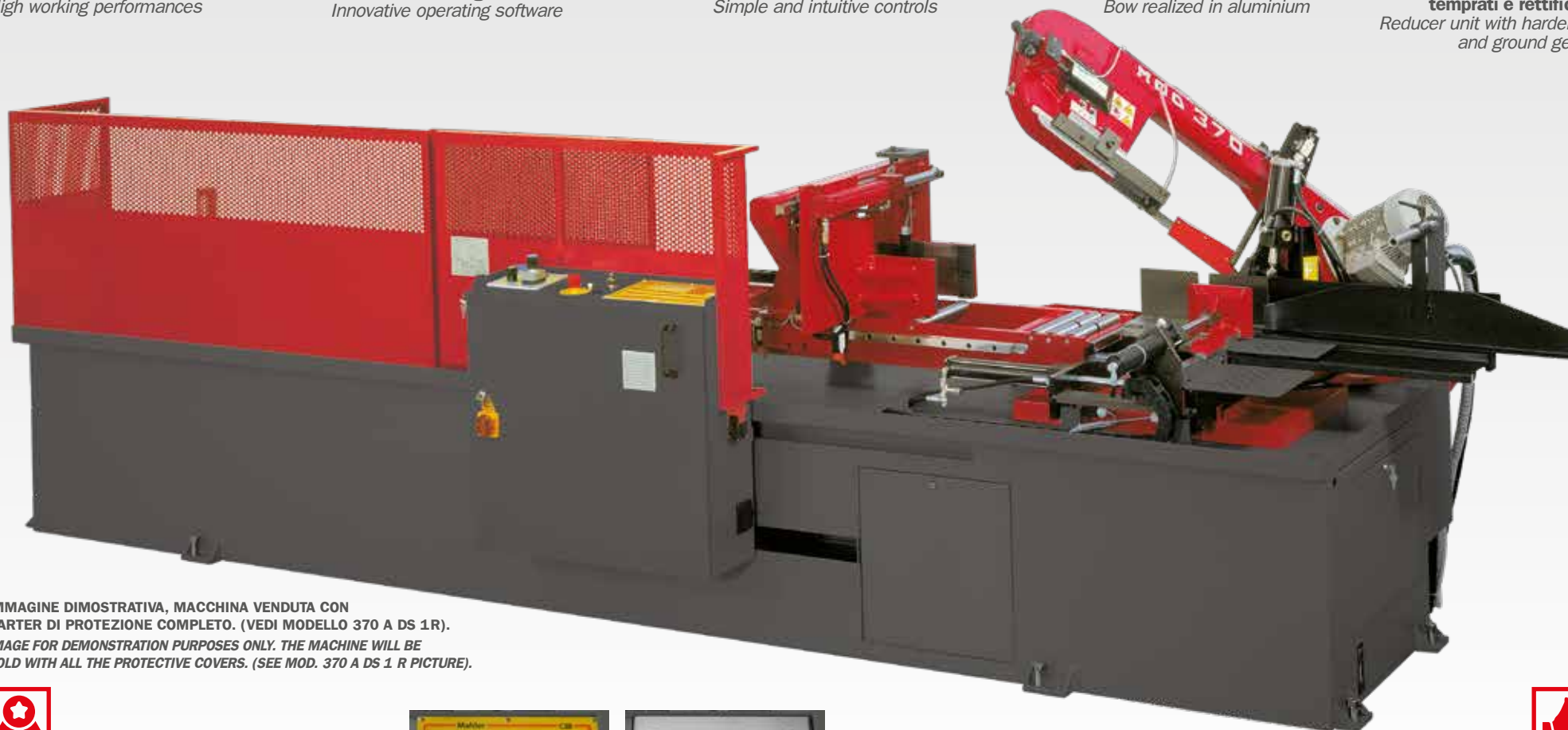
IMMAGINE DIMOSTRATIVA, MACCHINA VENDUTA CON CARTER DI PROTEZIONE COMPLETO. (VEDI MODELLO 370 A DS 1R). IMAGE FOR DEMONSTRATION PURPOSES ONLY. THE MACHINE WILL BE SOLD WITH ALL THE PROTECTIVE COVERS. (SEE MOD. 370 A DS 1 R PICTURE).

Riduttore con ingranaggi temprati e rettificati Reducer unit with hardened and ground gears