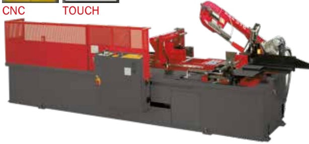
IMMAGINE DIMOSTRATIVA, MACCHINA VENDUTA CON CARTER DI PROTEZIONE COMPLETO. (VEDI MODELLO 370 A DS 1R).

IMAGE FOR DEMONSTRATION PURPOSES ONLY. THE MACHINE WILL BE SOLD WITH ALL THE PROTECTIVE COVERS. (SEE MOD. 370 A DS 1 R PICTURE).